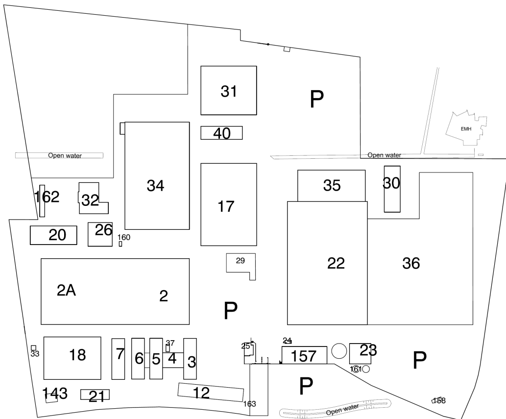
Fokker Aerostructures BV, Edisonstraat 1 in Hoogeveen